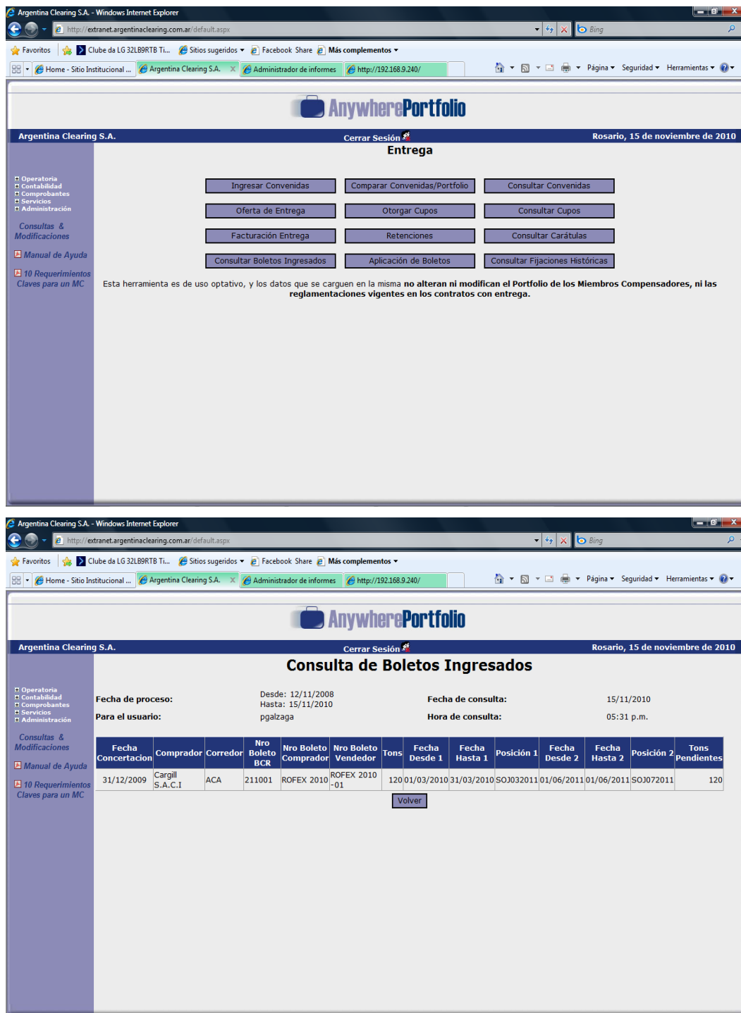
Ilustración 1: Vista de la Extranet de Argentina Clearing S.A.